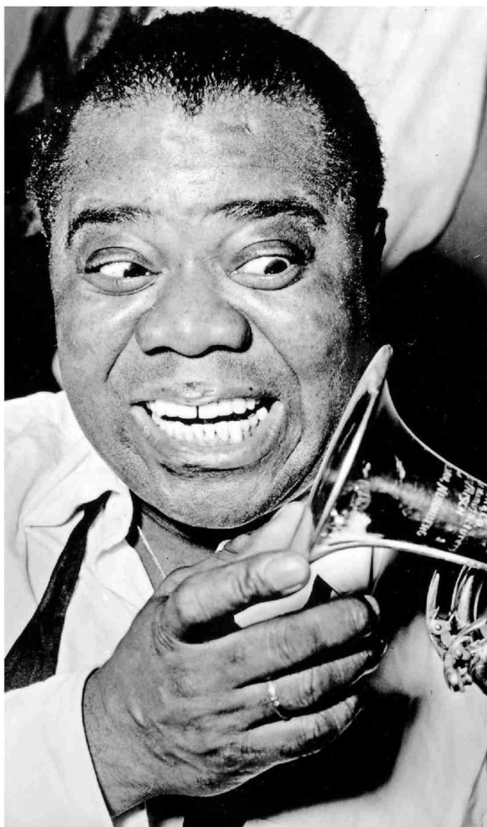
Le trompettiste Louis Armstrong, figure de proue d'une musique née à La Nouvelle-Orléans et partie hanter les nuits de part et d'autre de l'Atlantique.