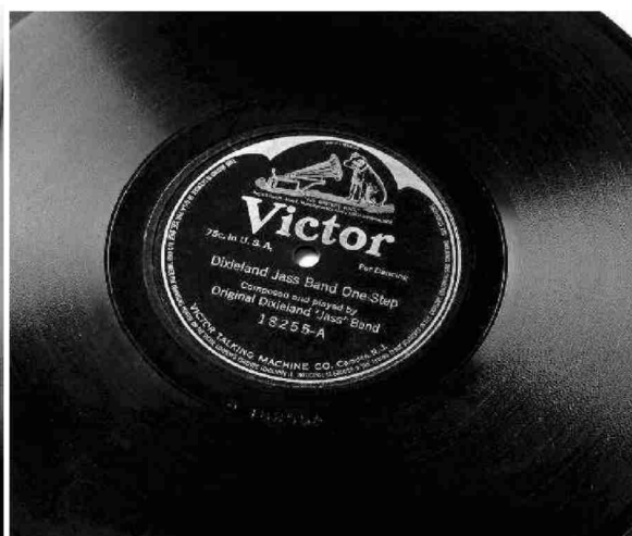
Commercialisé en 1917, Dixieland Jass Band One-Step est le premier disque de l'histoire du jazz.