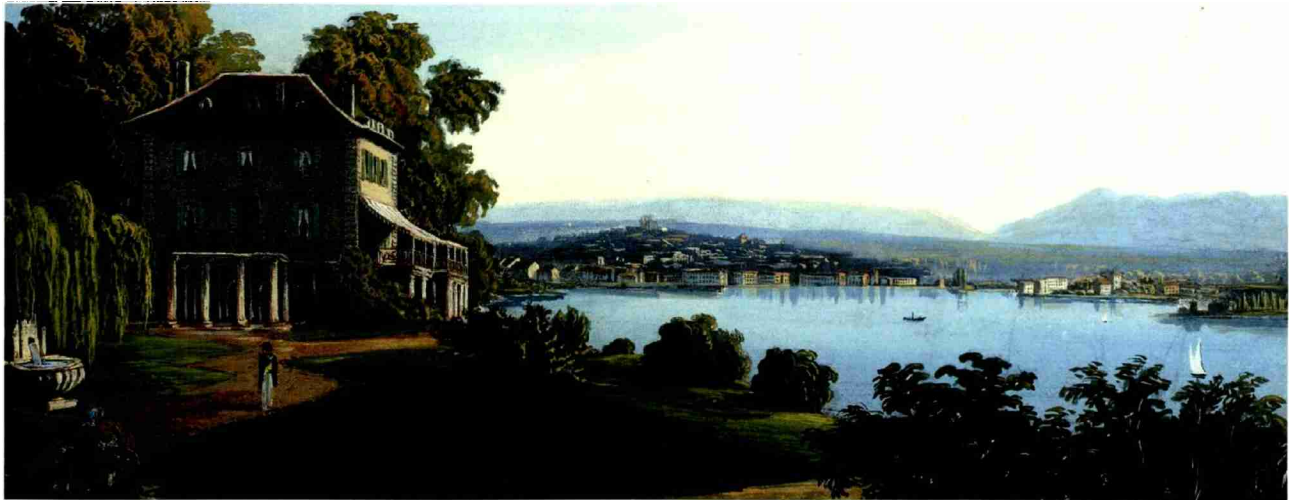
Cologny, vue de Genève prise de la maison de Diodati.

Themen-Nr.: 037.034 Abo-Nr.: 1088845 Seite: 2 Fläche: 115'005 mm 2