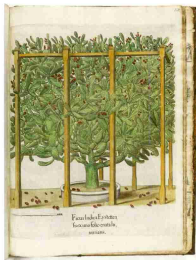
Otto Brunfels 1488-1534 in Herbarum(...)

19-21 route Martin-Bodmer | 1223 Cologny 022 707 44 36 | fondationbodmer.ch