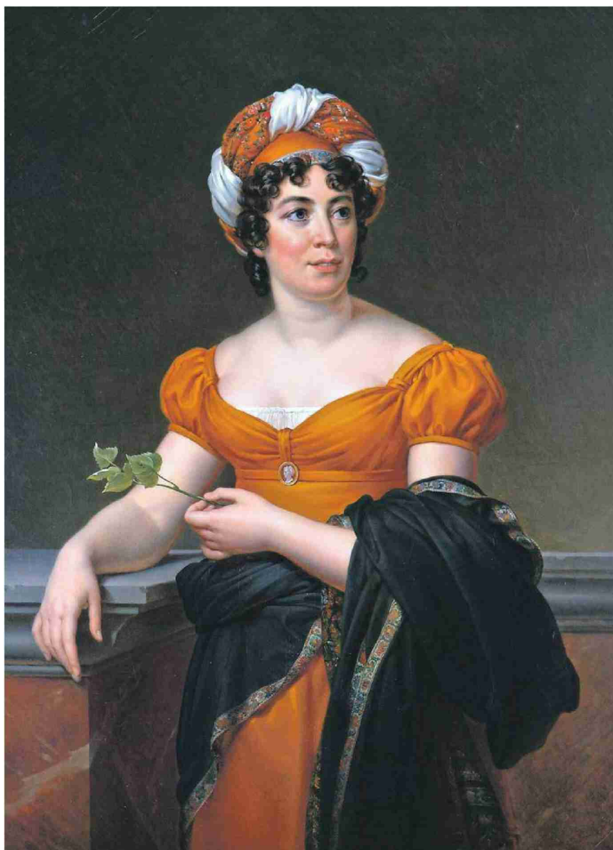
Germaine de Staël (par François Gérard, vers 1810) et Benjamin Constant (anonyme, vers 1815).

Ordre: 1088845 Référence: 65792700 N° de thème: 037.034 Coupure Page: 3/5