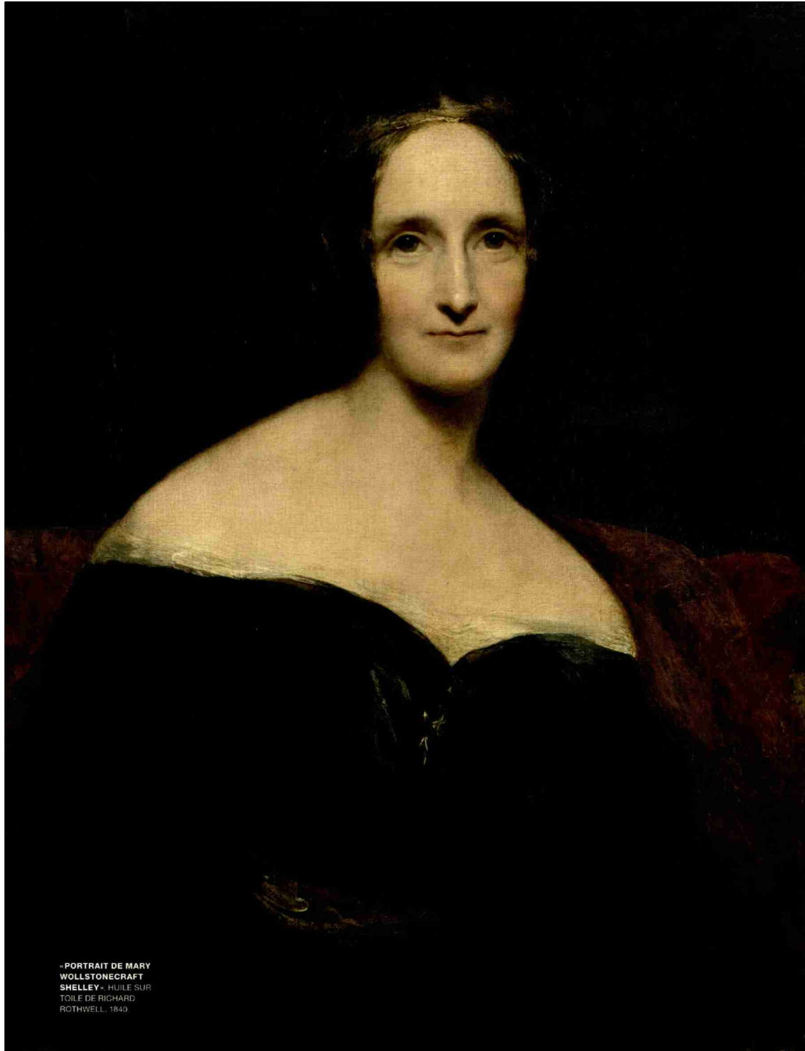
- PORTRAIT DE MARY WOLLSTONECRAFT SHELLEY - HUILE SUR TOILE DE RICHARD ROTHWELL, 1840.

N° de thème: 037.034 N° d'abonnement: 1088845 Page: 16 Surface: 273'294 mm 2