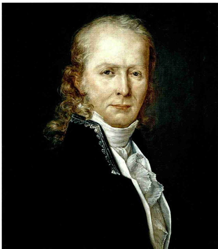
Portrait de Benjamin Constant, Musée de la Ville de Paris, Musée Carnavalet, Paris