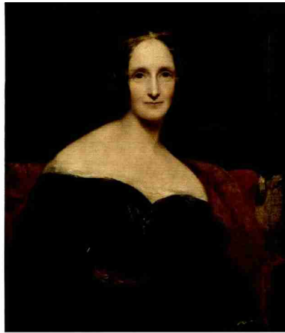
Richard Kneller, Portrait de Mary Walsingham Stuttgart, 1860, huile sur toile, 78,7 x 61 cm

Themen-Nr.: 037.034 Abo-Nr.: 1088845 Seite: 6 Fläche: 55'063 mm 2